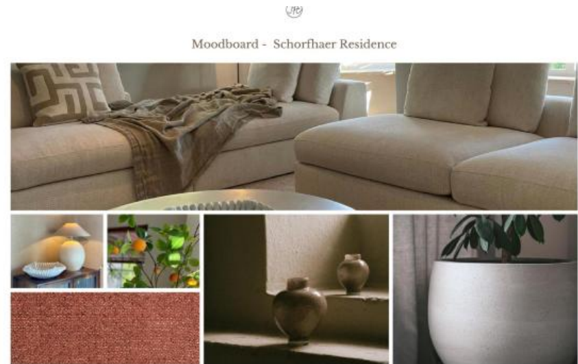
Maud Hesselink Interior & styling