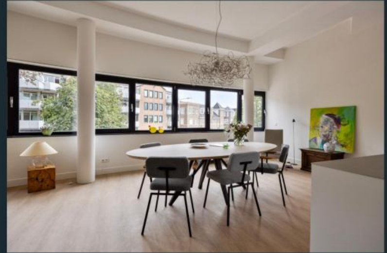
Impressie Steenstraat 44c