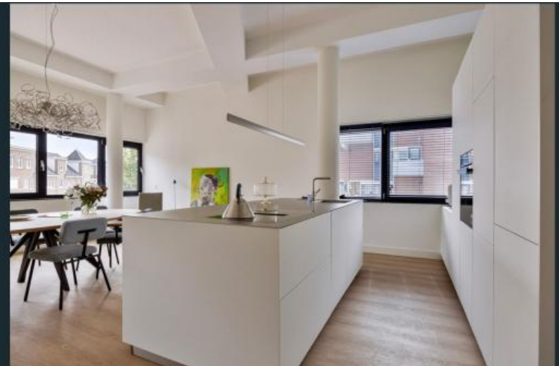
Impressie Steenstraat 44c