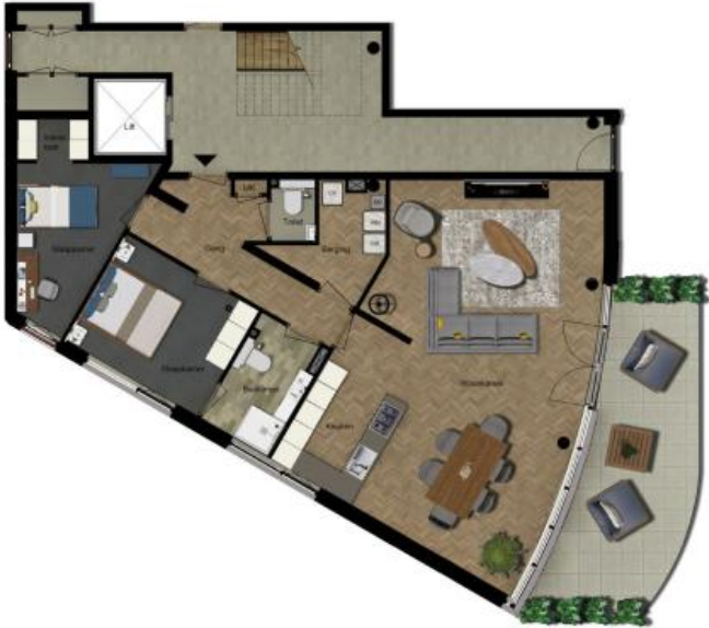
Begane grond Steenstraat 44a