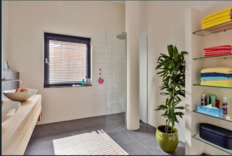
Impressie Steenstraat 44c