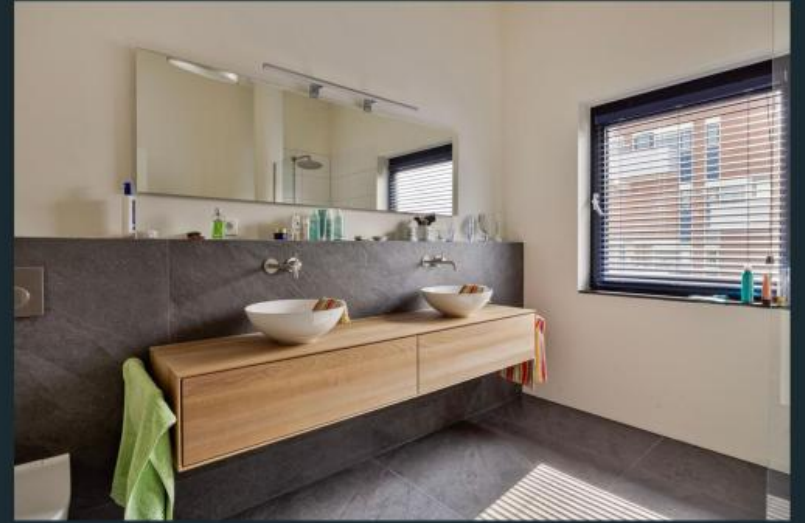
Impressie Steenstraat 44c