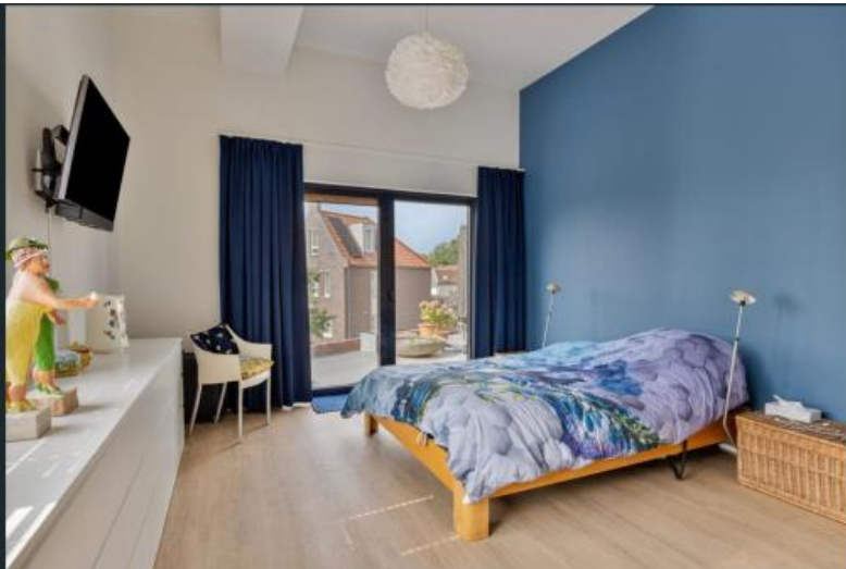
Impressie Steenstraat 44c