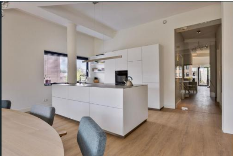
Impressie Steenstraat 44c