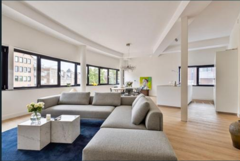
Impressie Steenstraat 44c